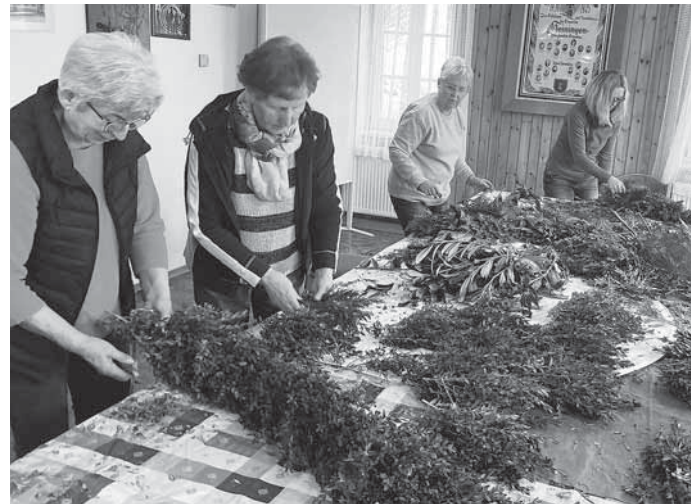
Fleißige Helferinnen beim Binden der Girlanden