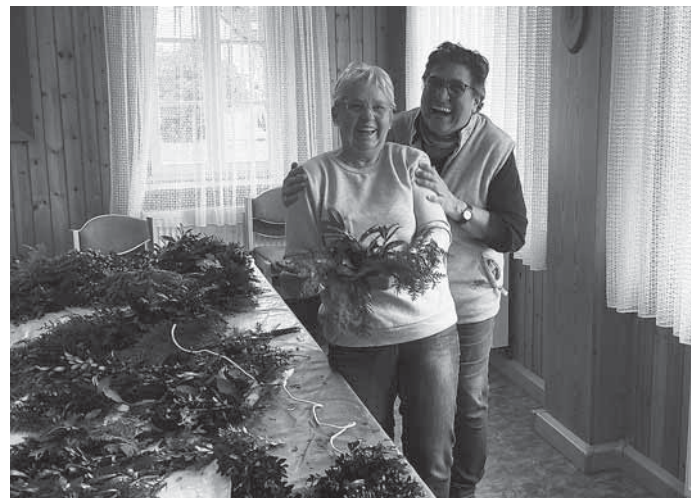
Und der Spaß kam auch nicht zu kurz