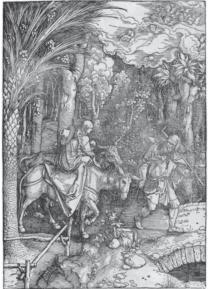
Albrecht Dürer, Die Flucht aus Ägypten (aus: Marienleben , Blatt 14), Holzschritt , um 1503/1504