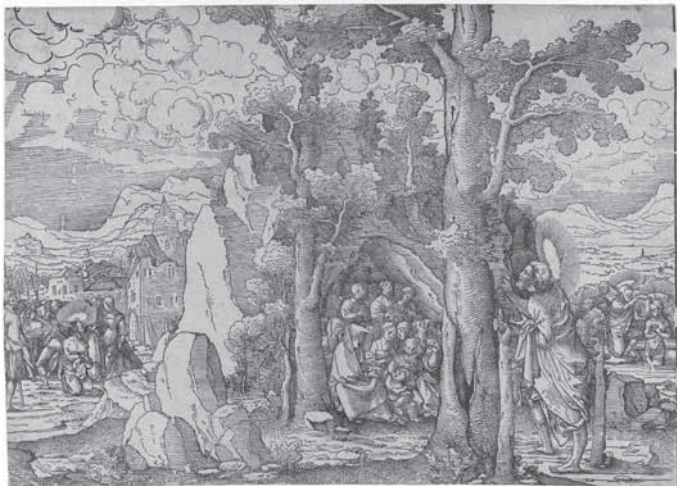
Frans Crabbe, Szenen aus dem Leben Johannes des Täufer, Holzschnitt, um 1522