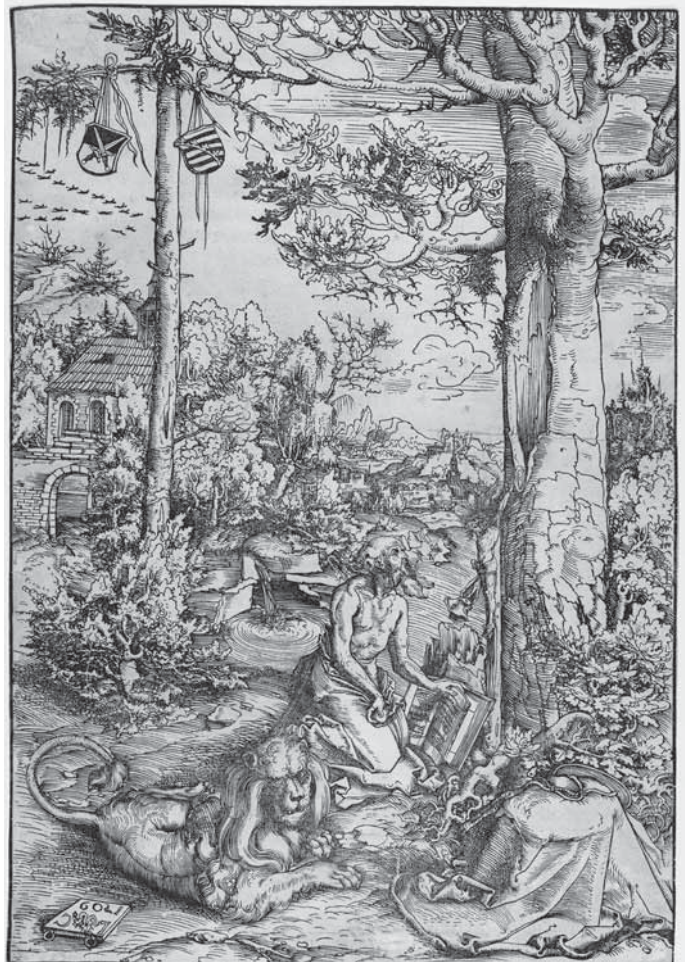
Lucas Cranach der Ältere, Büßender Hieronymus , Holzschritt 1509