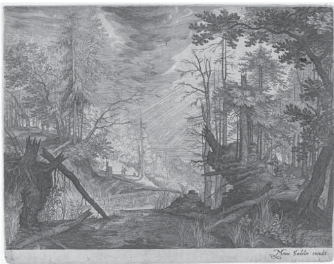
Aegidius Sadeler, Drei Jäger und ein Hund bei einem Tümpel, Kupferstich, um 1609