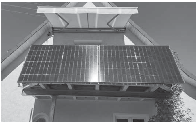
Balkonkraftwerke erfreuen sich großer Beliebtheit in Backnang.

Auch im letzten Quartal 2023 war die Nachfrage nach der kommunalen Förderung für Balkonkraftwerke ungebrochen hoch. Nach der Aufstockung des Fördertopfes Ende September durch den Gemeinderat konnten bis Jahresende weitere 42 Anträge bewilligt werden. Insgesamt wurden damit seit dem Start des Programmes im April des vergangenen Jahres 142 Anlagen mit je 100 Euro bezuschusst.