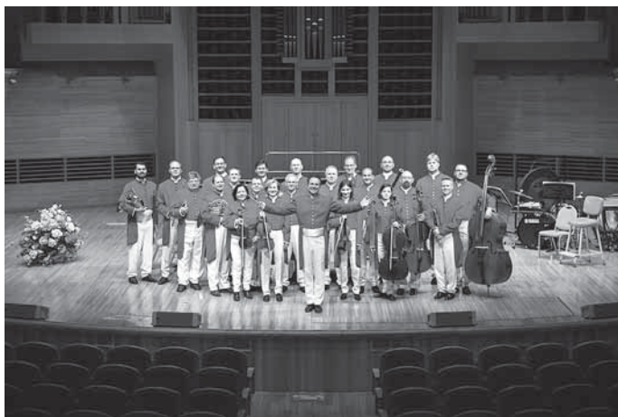
Beschwingt ins neue Jahr – Die Strauss Capelle Wien im Backnanger Bürgerhaus.

Die Veranstaltung findet statt mit freundlicher Unterstützung der Autohaus Mulfinger GmbH Backnang und der Staatlichen Toto-Lotto GmbH Baden-Württemberg. Der Beliebtheit des Neujahrskonzerts geschuldet, ist dieses bereits ausverkauft. Mit etwas Glück kann man an der Tageskasse ab 10:45 Uhr noch an eine Karte kommen.