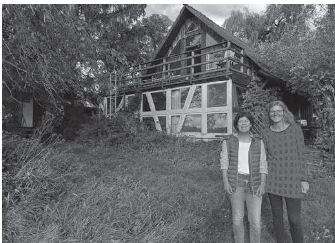
Frühlingszauber - 3 Tage mit der Natur“

„Frühlingszauber ...“ gibt uns in dieser hektischen Zeit Impulse für Loslassen, Genießen, Erholen, miteinander lachen, Natur in ihrer schönsten Form erleben und den Stress des Alltags beiseite zu schieben.