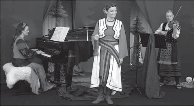
Das FlauschOhren-Ensemble kommt ins Bürgerhaus.

Weitere Informationen sowie Tickets zum Einheitspreis von 7 Euro für Kinder und Erwachsene gibt es online unter www.backnanger-buergerhaus.de , telefonisch unter 07191 894-567 oder per Mail an buergerhaus@backnang.de sowie beim Ticketvorverkauf im Backnanger Bürgerhaus und der Stadtbücherei zu den jeweiligen Öffnungszeiten.