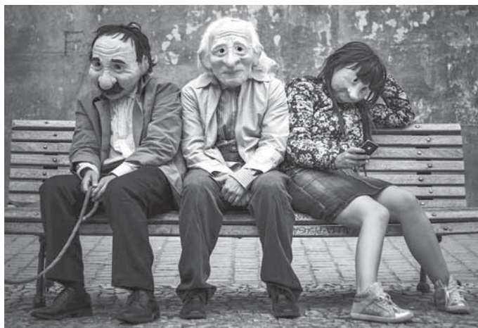
Das Kulunka Teatro gastiert im Backnanger Bürgerhaus.

Tickets ab 19 Euro, ermäßigt ab 15 Euro, gibt es unter www.backnanger-buergerhaus.de , 07191 894-567, buergerhaus@backnang.de sowie beim Ticketvorverkauf im Backnanger Bürgerhaus und der Stadtbücherei zu den jeweiligen Öffnungszeiten.