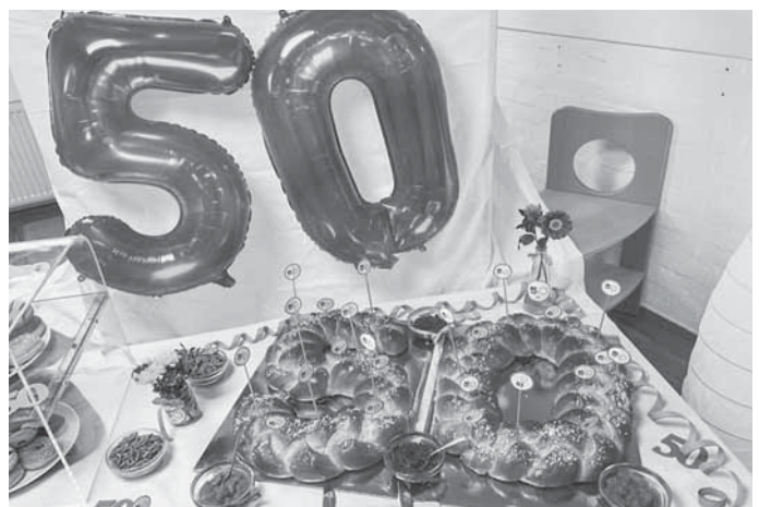
Auch für das leibliche Wohl war gesorgt.