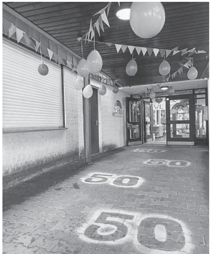
Die Gäste wurden Kunterbunt zu 50 Jahr Kita Bregenzer Straße begrüßt.

Frau Wüllenweber lobte die außerordentliche Leistung des Teams, welche eine geraume Zeit ohne Leitung überbrücken musste und unter anderem dieses tolles Fest geplant und vorbereitet hatte. Nach Liedern und Ansprachen gab es für alle Gäste ein reichhaltiges Buffet mit Laugen- und Hefengebäcken in Zahlenformen sowie Donuts und Muffins. Ein großes Dankeschön geht an das Hofgut Hagenbach für die großzügige Obst- und Gemüsespende. Ein Highlight für alle Gäste war die Popcornmaschine inkl. das bunte Bekleben der Popcornütten. Die Kinder konnten zudem in einem Bällebad toben oder Ballontiere modellieren lassen. Somit ging ein tolles Fest zu Ende. Auf weitere kunterbunte 50 Jahre Kita Bregenzer Straße.