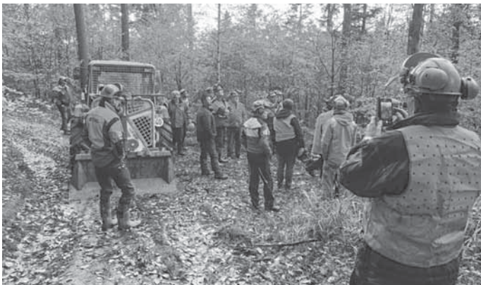
Die Teilnehmer beim Seilwindenlehrgang