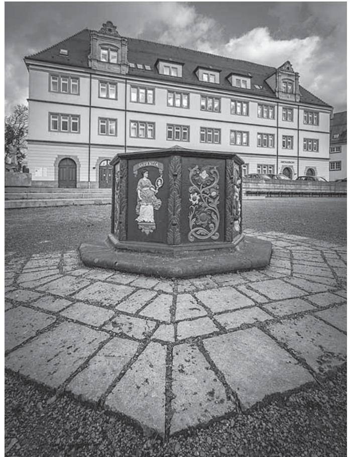
Bildunterschrift: Stiftshof mit Brunnen

Am Sonntag, 16. April, findet eine historische Stadtführung statt. Stadtführerin Gisela Weigle lässt bei dieser 90-minütigen Führung die spannende Stadtgeschichte der Fachwerkstadt lebendig werden. Die Führung beginnt um 14.30 Uhr am Amtsgericht im Stiftshof und kostet vier Euro. Um passende Bezahlung direkt vor Ort wird gebeten. Interessierte können sich bis Freitag, 14. April, beim Kultur- und Sportamt unter der Telefonnummer 07191 894-361 oder per E-Mail an tourismus@backnang.de zur Führung anmelden.