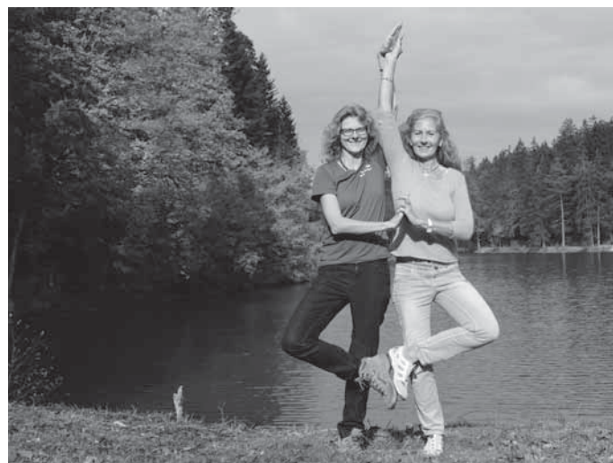
Selbstauflöser

Weitere Infos unter 0 71 91/ 31 86 53, mit-der-natur@web.de oder www.mit-der-natur.de