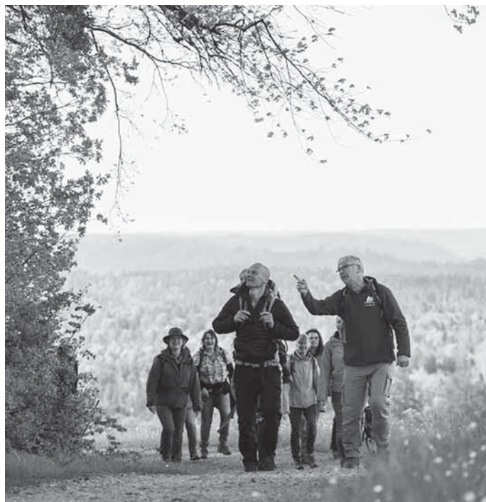
Bildunterschrift: Frühling mit den Naturparkführern Sanwald: Gemeinsam mit den Naturparkführern den Frühling willkommen heißen

Die Naturparkführer Schwäbisch-Fränkischer Wald e.V.