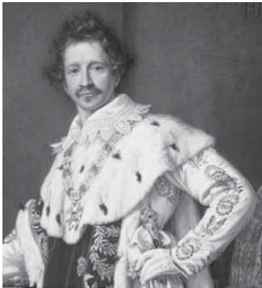
König Ludwig I. von Bayern