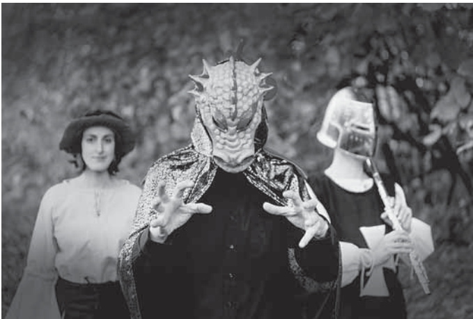
Das FlauschOhren-Ensemble kommt mit Ritter und Drache ins Bürgerhaus.

Weitere Informationen und Tickets für das Konzert gibt es zum Einheitspreis von sieben Euro für Kinder und Erwachsene im Backnanger Bürgerhaus unter der Telefonnummer 07191 894-567 oder buergerhaus@backnang.de sowie online unter www.backnanger-buergerhaus.de .