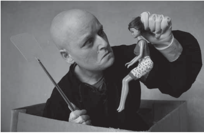
Bridge Markland „Räuberin in the Box“