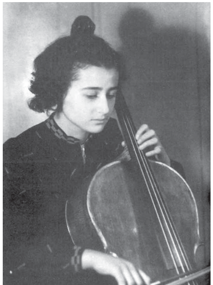
Die Cellistin und Holocaust-Überlebende Anita Lasker-Wallfisch.