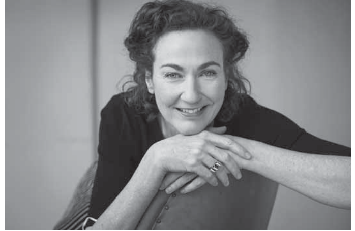
Die Schauspielerin Cornelia Schönwald liest Passagen aus dem Zeitzeugenbericht „Ihr sollt die Wahrheit erben“.

Tickets gibt es zu 17 Euro und ermäßigt zu 13 Euro zu den üblichen Öffnungszeiten im Backnanger Bürgerhaus, unter 07191 894-567 und buergerhaus@backnang.de sowie online unter www.backnanger-buergerhaus.de .