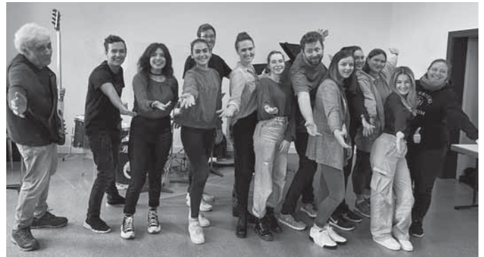
Die Schülerinnen und Schüler der Jugendmusik- und Kunstschule Backnang freuen sich, ihr musikalisches Können bei der Musical Night zum Besten zu geben.

der Eigenproduktion „Murr Stufen Story“ erhielt das Team den Spartenpreis als bestes selbstentwickeltes und komponiertes Musical beim Lotto-Musiktheaterpreis Baden-Württemberg 2016. Für den Herbst 2020 war ursprünglich die Aufführung des Elvis-Musicals „All shook up“ geplant. Notenmaterial und Aufführungsrechte waren eingekauft, die einzelnen Rollen besetzt. Das ganze Projekt fiel jedoch leider der Corona-Pandemie zum Opfer. So entstand nun aus diesen anfänglichen Plänen die Idee einer ersten Musical Night. Freuen Sie sich nun auf Hits und Highlights aus verschiedenen bekannten und beliebten Musicals.