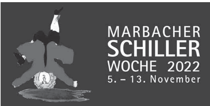
Schillerwoche 2022 Banner

Weitere Informationen erhalten Sie unter: www.schillerstadt-marbach.de/schiller-co/friedrich-schiller/schillerwoche-2022/ www.schillersgeburtshaus.de www.dla-marbach.de