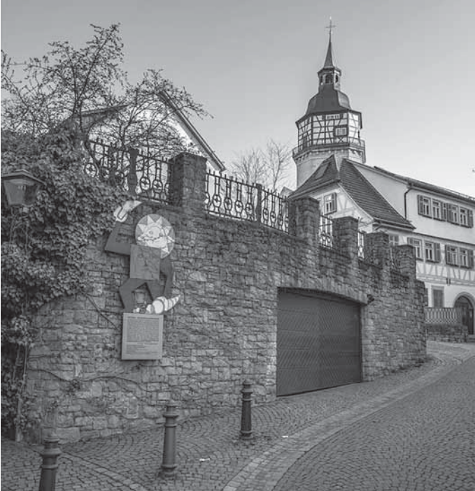
Gasse in Backnang

Bei dieser 90-minütigen Tour durch die verwinkelten Gassen der Innenstadt lässt Stadtführerin Christina Rieger die spannenden Traditionen und Geschichten Backnangs aufleben. Die Teilnehmerinnen und Teilnehmer erfahren dabei mehr über die abwechslungsreiche und beeindruckende Geschichte der Fachwerkstadt.