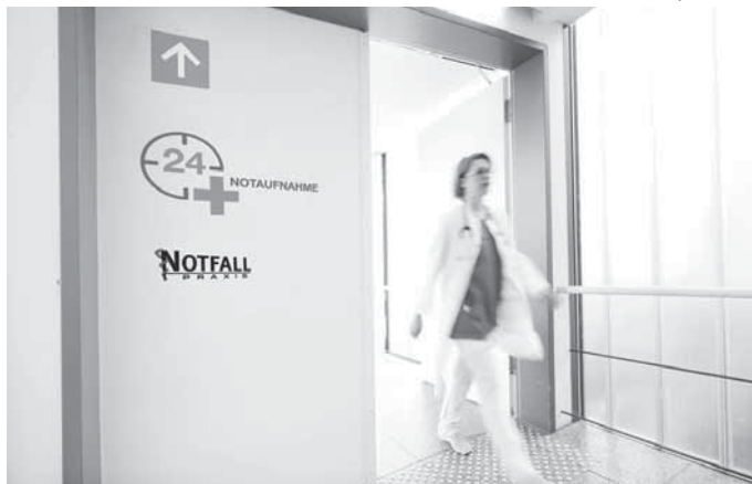
Schnell im Einsatz: Die Interdisziplinäre Notaufnahme der Rems-Murr-Klinik Schorndorf ist gut aufgestellt, damit Hilfesuchende jeden Tag eine zuverlässige Anlaufstelle haben.