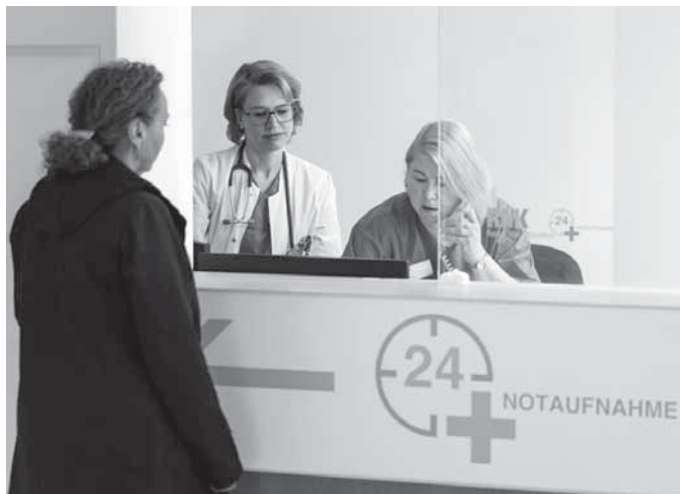
24 Stunden im Dienst: Am Empfang der Interdisziplinären Notaufnahme der Rems-Murr-Klinik Schorndorf erfasst das Team zunächst die Daten der Notfallpatienten.

In einer akuten lebensbedrohlichen Situation rufen Sie bitte sofort den Rettungsdienst unter Notruf-Tel. 112 an, der Sie in die Notaufnahme bringt.