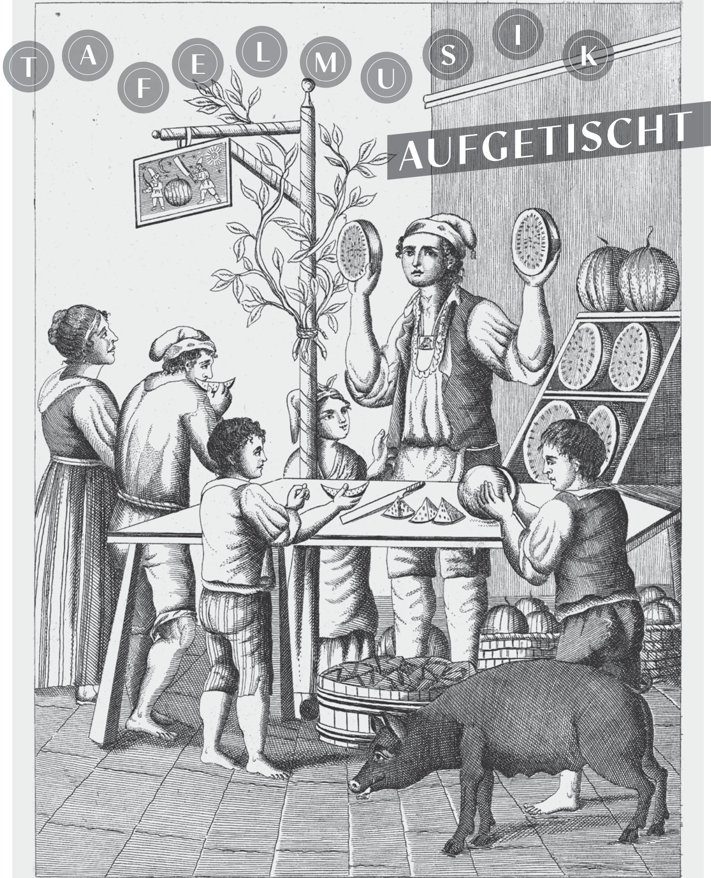
VENDITORE DI MELONE D'ACQUA -