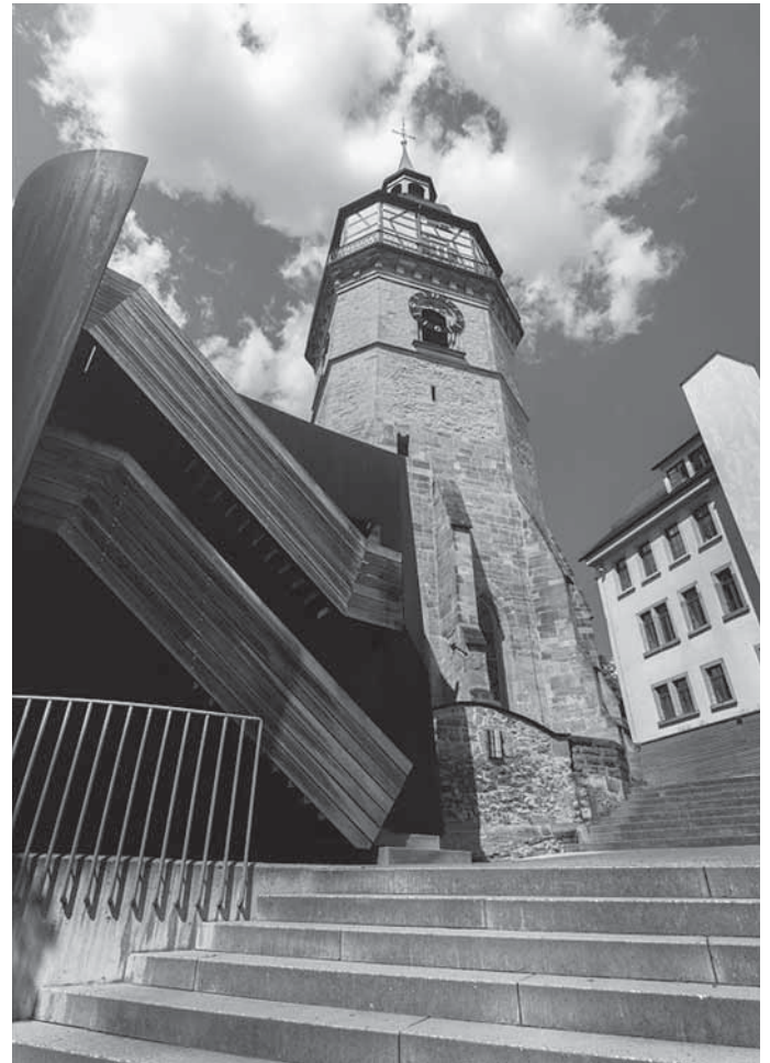
Stadtturm und Treppen am Markgrafenhof