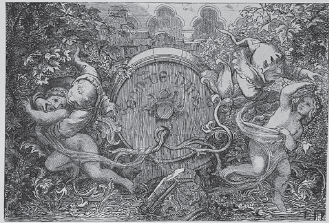
Eugen Napoleon Neureuther, Weinfass mit Gnomen, Radierung, 1844

In Literatur und Kunst, wie etwa den Graphikfolgen Eugen Napoleon Neureuthers (1806 - 1882) wird Wein zum Ausdruck eines unbeschwerten Lebensstils. Die von dem Münchner Radierer ins Bild gesetzten Weinlagen werden zum Teil heute noch bewirtschaftet.