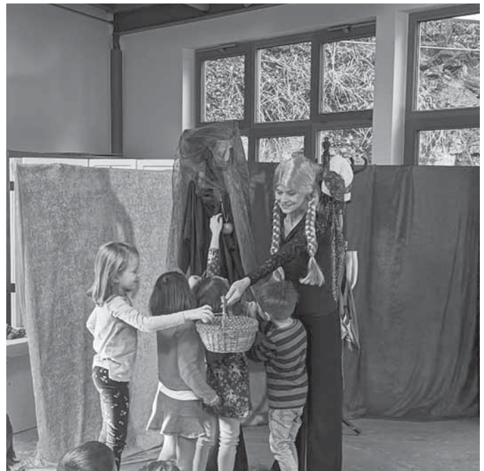
Bildunterschrift: Besuch des Galli-Theaters Backnang in der Kita Ilse.

Auch im Nachhinein ist das Märchen seitdem im Kita-Alltag durch Gespräche, Rollenspiele und Lieder sehr präsent. Die Kita bedankt sich herzlich beim Galli-Theater Backnang für die schöne und auch lustige Märchenstunde und hofft, dass Frau Holle diesen Winter ganz fleißig ihre Kissen ausschütteln wird.