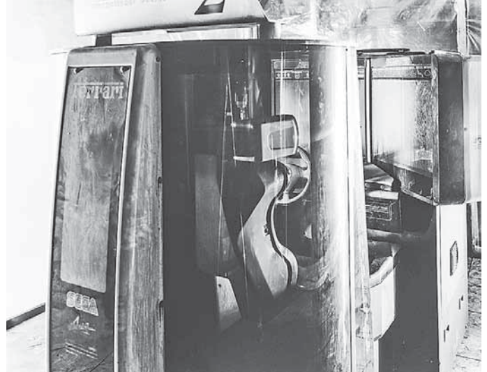
Ricarda Roggan, Reset 3, 2011

Der Einlass zur Ausstellung ist nur mit Mund-Nasen-Schutz gestattet und der Mindestabstand von 1,5 Metern zu anderen anwesenden Personen ist einzuhalten. Die maximal zulässige Anzahl der Personen im Haus ist begrenzt, weshalb unter Umständen mit Wartezeit gerechnet werden muss.