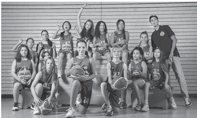
Unsere U12 weiblich