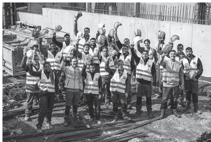
Die Mitarbeitenden der Rommel Bauunternehmung GmbH freuen sich über den diesjährigen Ausbildungspreis der Handwerkskammer Region Stuttgart.

Weitere Informationen zu primAQ: www.hwk-stuttgart.de/primAQ