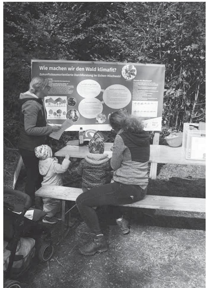
Waldtag Plattenwald - Wald im Klimawandel

Besonders beeindruckend war die Darstellung der heimischen Amphibien sowie die umfassende Information über den Wald im Kontext des Klimawandels.