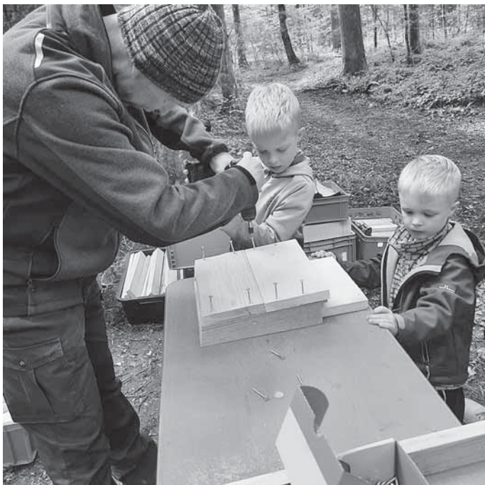
Waldtag Plattenwald – Fledermaus-Kastenbau

Ein Höhepunkt der Veranstaltung war die Demonstration von Waldarbeiten durch ein Rückepferd. Die Gäste staunten, als sie sahen, wie das Pferd Baumstämme mit einem Gewicht von bis zu 700 Kilogramm zog. Zudem wurde der Bogen zur mechanischen Holzernte mit einem sogenannten Harvester und der weiteren Verwendung des nachwachsenden Rohstoffs Holz gespannt, was den Gästen einen umfassenden Einblick in die moderne Forstwirtschaft bot.