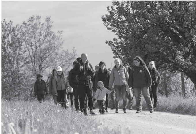
Herbst mit den Naturparkführern Sanwald: Kunterbunter Herbst mit den Naturparkführern

Diese und viele weitere Termine finden sich in der „Naturpark aktiv“-Broschüre und auf www.die-naturparkfuehrer.de .