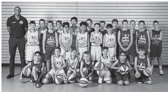
Unsere U12 männlich

Anfragen bitte schriftlich per WhatsApp an die 01567 8 34 91 12