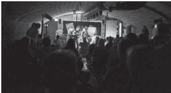
Open Stage 2022

Bewerbung für Künstlerinnen und Künstler bis zum 26. Oktober 2024 erforderlich unter openstage@kulturforum-schorndorf.de mit Angaben zu Name, Alter, Genre, Besetzung, eigenem Equipment, Kurzbeschreibung des Auftritts und zwei Sätzen zur eigenen Person. Weitere Informationen zur Bewerbung unter www.kulturforum-schorndorf.de . Für jeden Act sind maximal 10 Minuten Spielzeit geplant.