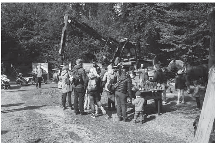
Waldtag Plattenwald - Holzernte

Ein Höhepunkt der Veranstaltung war die Demonstration von Waldarbeiten durch ein Rückepferd. Die Gäste staunten, als sie sahen, wie das Pferd Baumstämme mit einem Gewicht von bis zu 700 Kilogramm zog. Zudem wurde der Bogen zur mechanischen Holzernte mit einem sogenannten Harvester und der weiteren Verwendung des nachwachsenden Rohstoffs Holz gespannt, was den Gästen einen umfassenden Einblick in die moderne Forstwirtschaft bot.