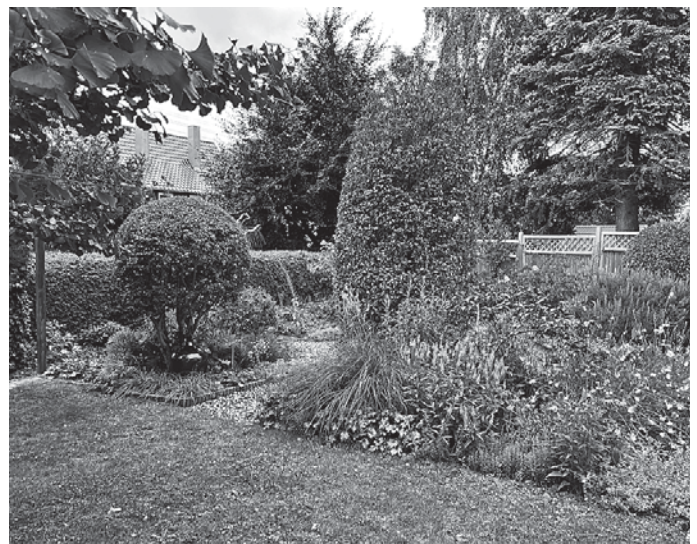
Die prämierten Gärten des Wettbewerbs 2024 zeigen eindrucksvoll die Kreativität und Hingabe der Backnanger Gärtnerinnen und Gärtner.

Preise 2024: 1. Preis: 30 Euro Backnang Kärtle und ein Sachbuch „Nutzgarten – kleine Gärten – so viel drin“ von Anja Klein bzw. „Natürlich schön & wild umschwärmt“ von Sonja Schwingesbauer. 2. Preis: 20 Euro Backnang Kärtle