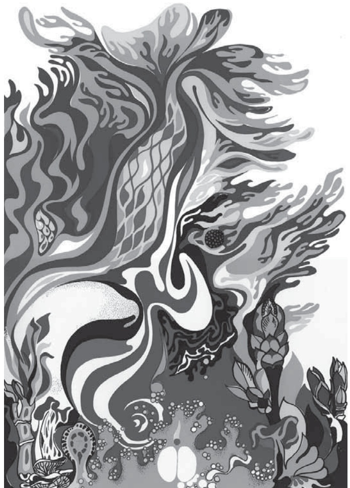
Hellmut G. Bomm, o. T. (grüne Komposition), Siebdruck, 1970