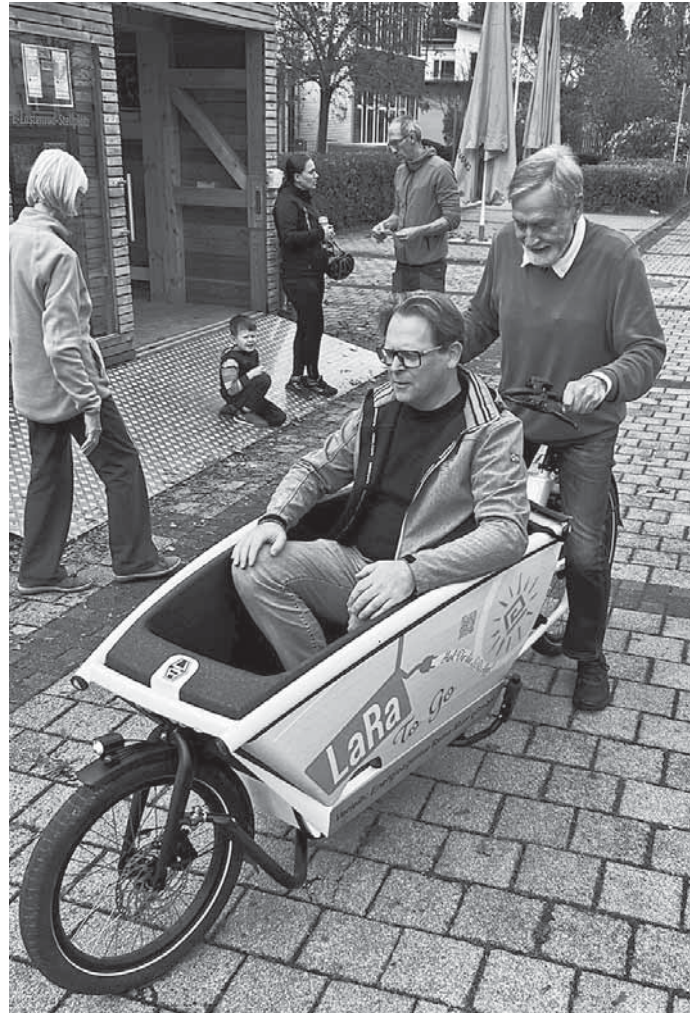
„Testfahrt mit Last“