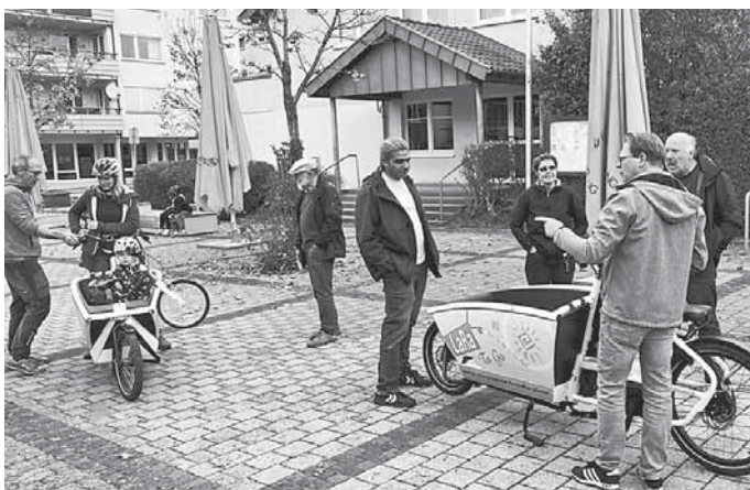
„Erklärung der E-Lastenräder“