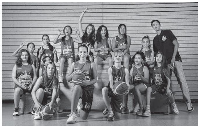
Unsere U12 weiblich

Durch den Hype, den das 3 x 3 Streetballturnier der Damen bei Olympia ausgelöst hat, bieten wir 1 x Woche einen 3 x 3 Abend an. Hier kann man einfach kommen, mit anderen Spielerinnen und Spielern ein Team bilden und dann bei cooler Musik etwas zocken. Ideal für Spielerinnen und Spieler, die dem Ligabetrieb nicht so viel abgewinnen können und trotzdem am Ball bleiben wollen.